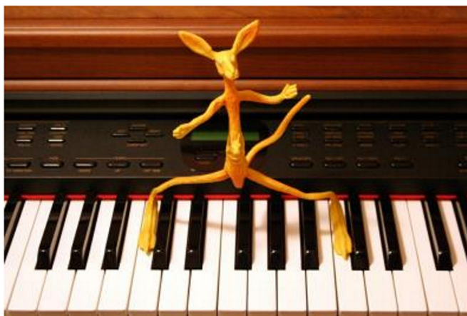
Abbildung 9: Oktave finden

Mit Hilfe einer kleinen Kängurufigur [NEUE RECHTSCHREIBUNG!] kann man Tastenabstände auf spielerische Art und Weise veranschaulichen. Man kann die langen Kängurubeine so positionieren, dass sie eine ganze Oktave oder auch kleinere Tastenabstände umfassen (siehe Abbildung 9). Die Figur kann sich sowohl auf den schwarzen als auch auf den weißen Tasten bewegen.