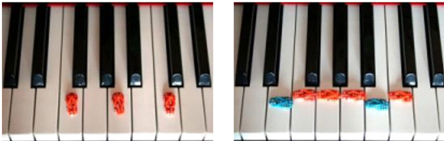
Abbildung 8: Tasten bestimmen

verteilt (siehe Abbildung 7). Auf den Tasten werden so viele Schuhe verteilt, wie viele Kinder es in der Gruppe gibt – zum Beispiel vier. In einem gegebenen Zeitraum bekommen die Kinder die Aufgabe, einzeln ans Klavier zu kommen und den Namen der mit einem Schuh gekennzeichneten Taste zu bestimmen. Wenn sie richtig antworten, dürfen sie nicht nur den Schuh behalten, sondern auch den dazugehörigen Buchstaben. Je mehr Buchstaben man hat, desto besser können aus ihnen Wörter gebildet werden. Man kann auch die vorgegeben Wörter ertönen lassen, wie etwa das Wort B-A-C-H. Es gibt viele Varianten, wie man mit Tonbuchstaben spielen kann, etwa wenn Kinder bestimmte Wörter erhalten, die sie auf der Tastatur suchen und wozu sie die entsprechenden Schuhe sammeln sollen.