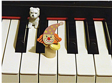
Abbildung 6: Taste E „Evan“

Rechts von der Taste D sitzt „Evan“, der „eats everything“ („Evan, der alles isst“). Evan ist eine hausgemachte Holzfigur (siehe Abbildung 6). Er mag Spass machen und liebt, wenn ihn (die Taste E) Kinder in verschiedenen Oktaven suchen, wenn sie den Text dabei rhythmisieren und zeigen, wo die höchste, bzw. die niedrigste Taste E liegt.