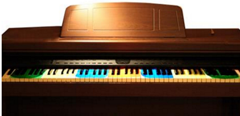
Abbildung 1: Farbige Klaviatur

Vor dem Beginn der Motivationsphase bedeckt der Lehrer die weißen Tasten der Klaviatur mit farbigen Transparentfolien, deren Form die Klaviatur spiegelt und stets eine Oktave abdeckt (siehe Abbildung 1). Die eingestrichene Oktave wird mit einer roten Folie markiert, die weiteren Oktaven werden so markiert, dass stets zwei Oktaven mit zwei Folien gleicher Farbe symmetrisch von der Mitte aus bedeckt werden (z. B. blau, gelb, grün). Den Kindern ist zu erklären, dass die Klaviatur aus Gruppen der gleichen Noten besteht, die sich nur durch ihre Tonhöhe voneinander unterscheiden. In der roten Oktave „wohnen“ die meisten Kinderlieder, die roten Tasten sind dann die Noten, welche die Kinder in der Schule zuerst schreiben lernen. Nach rechts nimmt die Tonhöhe zu, nach links steigt sie ab.