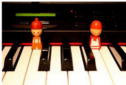
Abbildung 7: Beispiel für die Besetzung der Tasten F und H

Mit den Tasten F, G, A, H wird nun die Phantasie der Kinder angeregt: Die Schüler sollen herausfinden, wer hier wohnen könnte, sie sollen der Figur einen passenden Namen geben und für sie einen Reim erfinden. Sie sollen auch versuchen, zu Hause eine geeignete Figur für die entsprechende Taste zu finden oder herzustellen (siehe Abbildung 7).