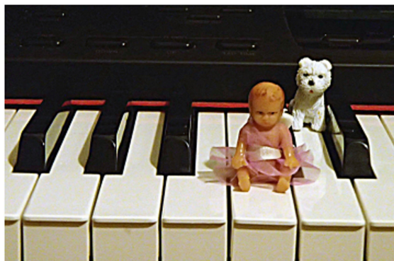
Abbildung 5: Taste C „Cindy“

Links von der Taste D sitzt ein kleines Mädchen namens Cindy, das gerne ihr Lieblingslied „Cindy sings songs“ („Cindy singt Lieder“) singt. Cindy ist eine winzige Puppe (siehe Abbildung 5). Sie kann auch springen, so dass sie in verschiedenen Oktaven spielen kann.