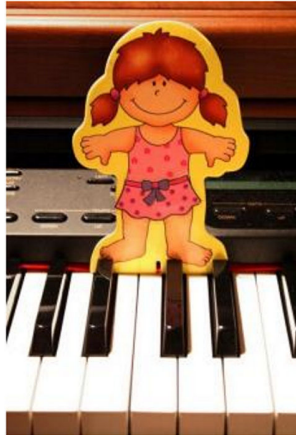
Abbildung 2: Wo sitzt man richtig am Klavier?

Hinter den Tasten c1-e1 sitzt eine flache farbige Männchen- oder Puppenfigur aus harter Pappe, die für den Klavierspieler die richtige Sitzposition anzeigt. Sie deutet auch auf die Note c1, von welcher aus die Kinder ein Lied singen können (siehe Abbildung 2).