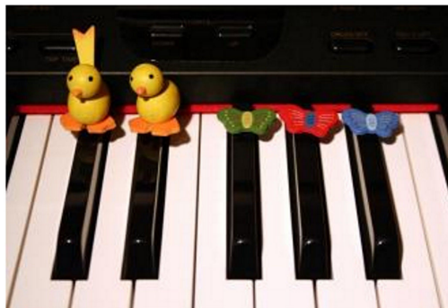
Abbildung 3: Klaviertiere

Auf jede der beiden schwarzen Tasten setzt der Lehrer je einen kleinen Holzvogel, der von unten mit einem Klebeband so versehen ist, dass er sanft und ohne Beschädigung der Klaviatur wieder entfernt werden kann (siehe Abbildung 3). Die drei schwarzen Tasten sind mit in der gleichen Art und Weise angebrachten kleinen hölzernen Schmetterlingen gekennzeichnet. Auch sie sind so befestigt, dass sie die Tastenanschläge ohne weiteres gut ermöglichen. Die Tierchen können auf den weißen Tasten mit Farbfolien ergänzt werden.